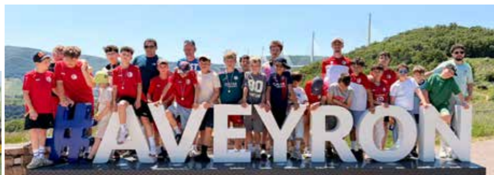
Les U12 & U13 ont brillamment participé à un tournoi à Puissalicon dans l'Herault

Le club a organisé également de nombreuses manifestations au cours de la saison, montrant à plusieurs reprises son fort ancrage au sein de la commune et aux côtés de celle-ci, qu'il remercie au passage pour l'ensemble des aides apportées, qu'elles soient financières ou matérielles. "On sent une commune proche des associations. Et cela se traduit au quotidien par des actions qui nous permettent d'avancer et de