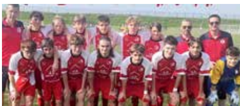
Les U15 ont fait une belle saison d'apprentissage et ont été éliminés en demi finale de la coupe d'Artois par Noeux les Mines

jeunes, plaident en la faveur du président et de son équipe. Comme le beau parcours des U18 en coupe Gambardella qui ont atteint la finale régionale et affronté le Racing-club de Lens devant plus de six cents personnes. Les U17 sont toujours en course (à l'heure où nous envoyons ces lignes) pour accéder, l'an