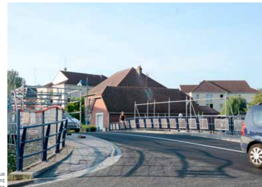
Rue Laurent Gers

La première phase des travaux, menée par le Département, qui s'est terminée fin août, a vu la réfection de l'étanchéité du pont, la pose d'enrobé et la réfection des trottoirs. « Ce n'a pas été simple avec la gestion du trafic qui voit passer 13 000 véhicules par jour. Mais tout s'est très bien passé, et les travaux ont même fini quelques jours avant. » Une deuxième phase va voir le jour avec la sablage de la structure et la remise en état des garde-corps. « Il n'y aura pas de coupure de circulation, juste une alternance pour l'utilisation des trottoirs. » Rappelons que ce pont date de 1941 et qu'il enjambe la Scarpe. La première phase des travaux a permis à Nexity d'alimenter la résidence face à la mairie en électricité et en gaz.