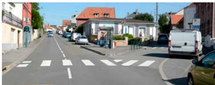
rue Estenne Cauchy

Les feux installés du côté de la rue Barbusse et de la cité d'Herwin vont être mis en service en fin de mois.