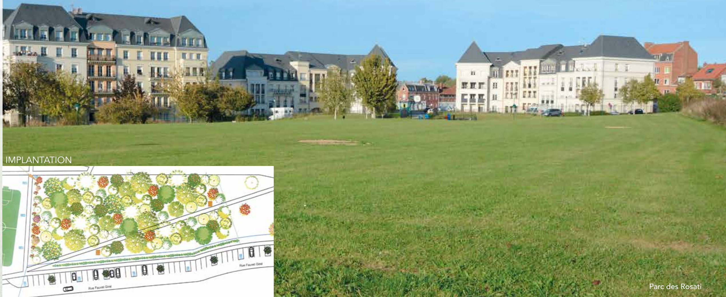
Parc des Rosati