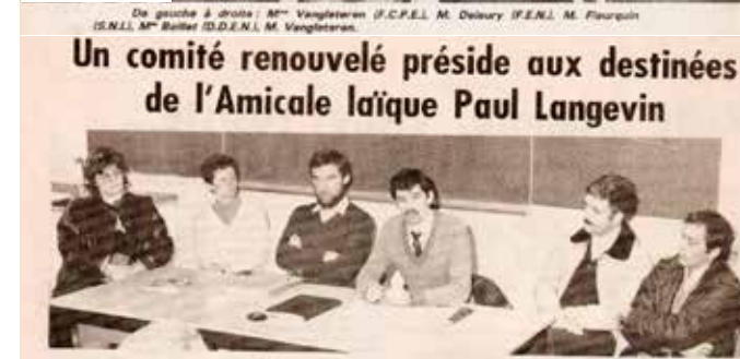
10 mars 1985