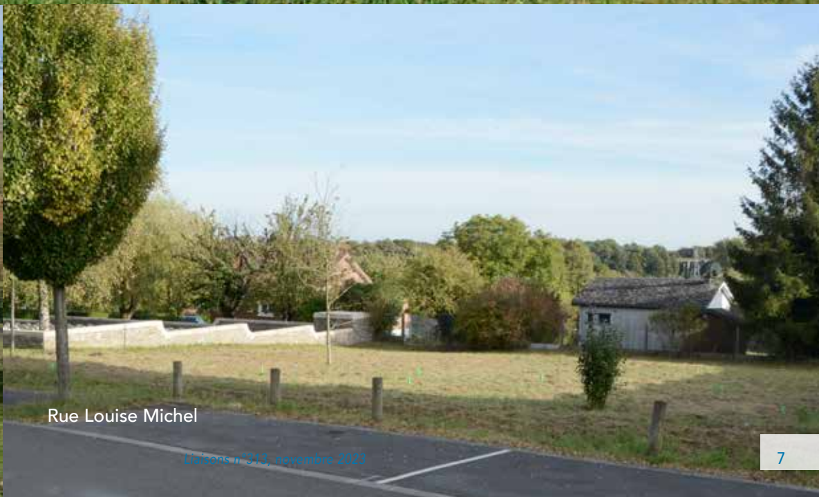
Rue Louise Michel