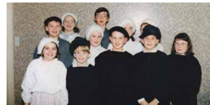
Jeunes du groupe des jeunes patoisants