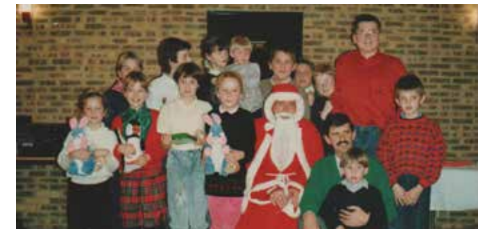
Noël de l'Amicale Laïque