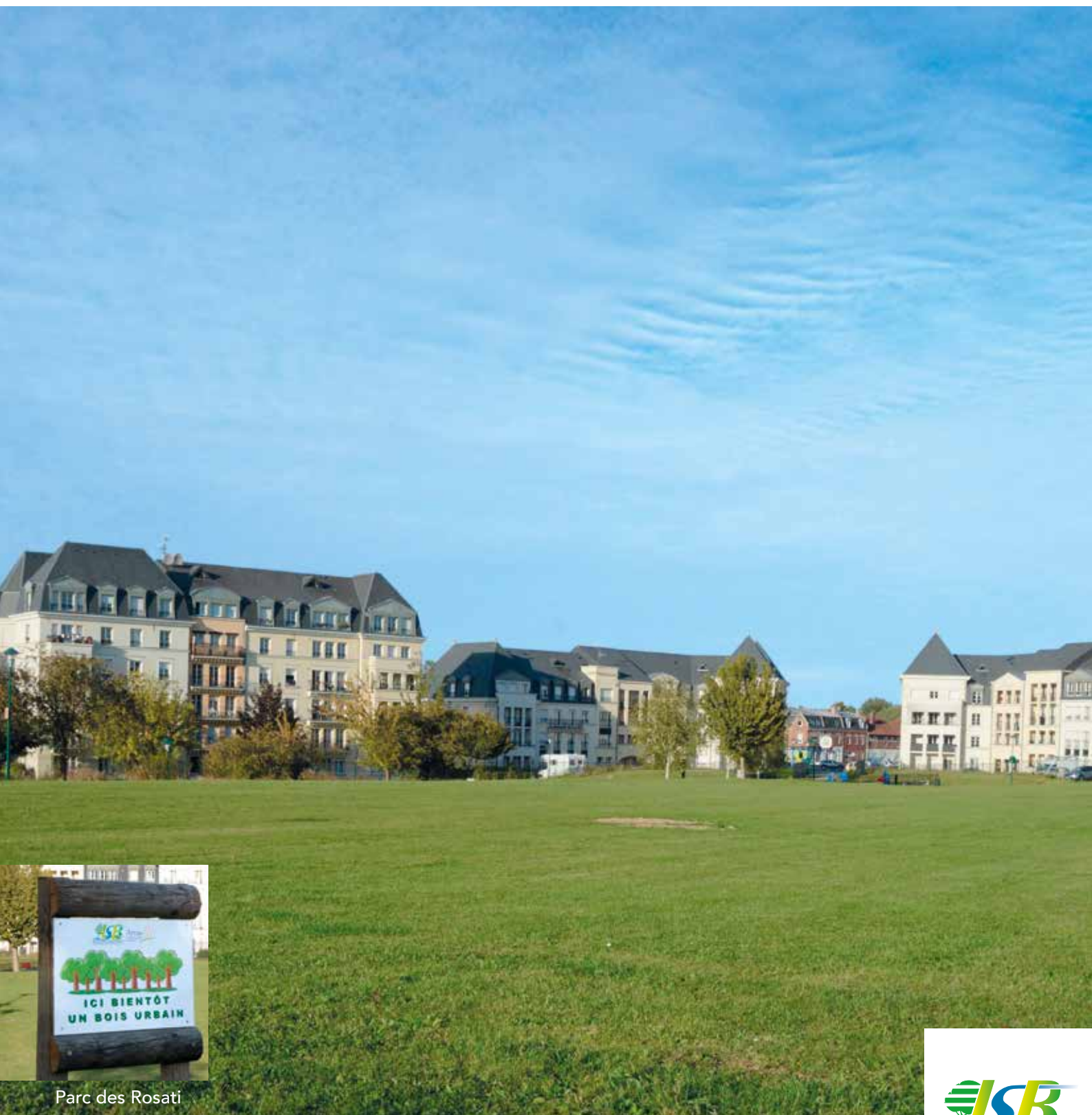
Parc des Rosati

SAINT-LAURENT-BLANGY MAGAZINE D'INFORMATION MUNICIPALE