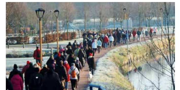
Marche des Rois