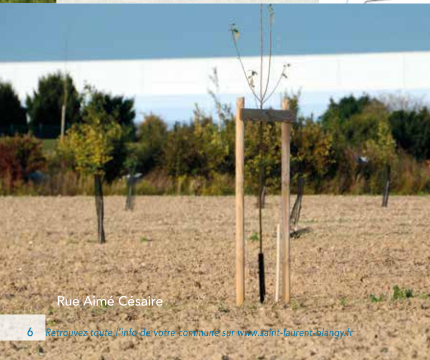
Rue Aimé Césaire