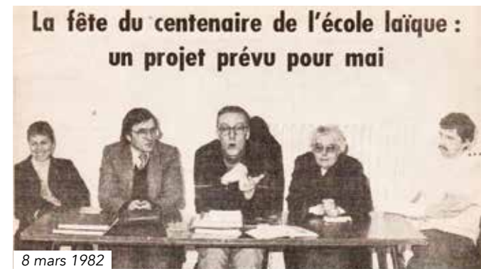
8 mars 1982