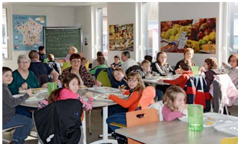
Cantine intergénérationnelle - 9 février