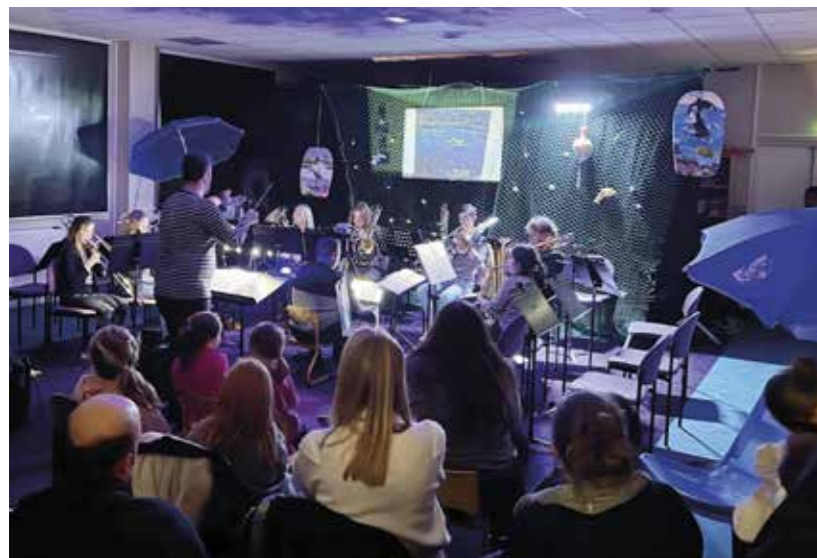
Concert Écol'Eau'Zik à l'école de musique - 31 janvier