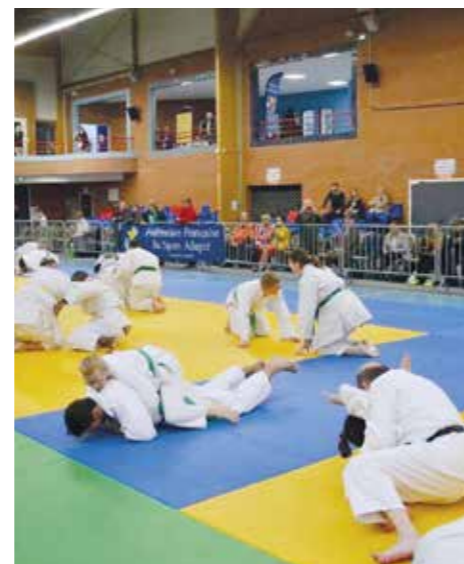
Championnat régional handi judo - 14 janvier