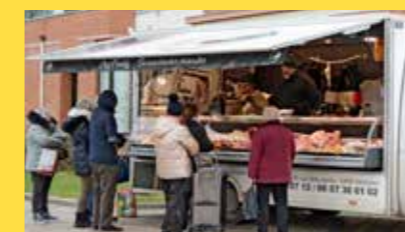
Freddy Flament, boucher charcutier