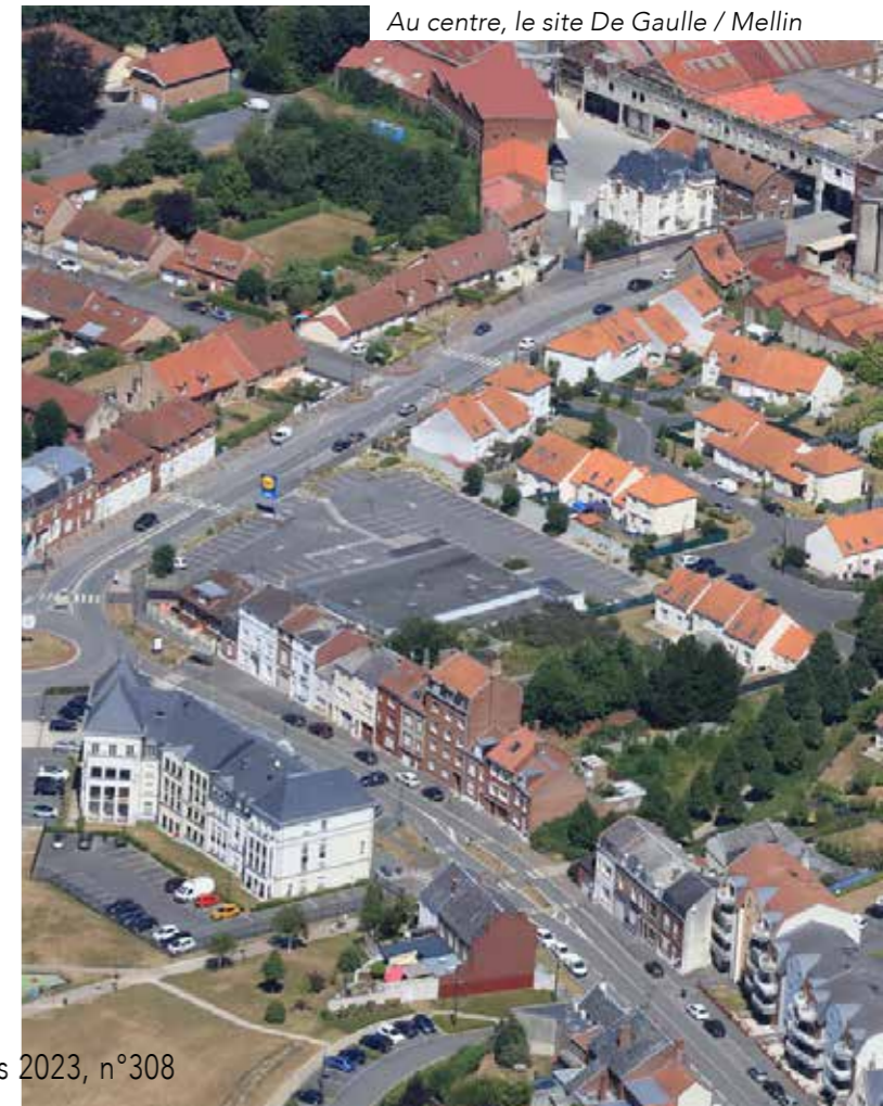
Au centre, le site De Gaulle / Mellin

Pour l'ancien Lidl, à l'angle des rues De Gaulle et Mellin, je reçois des demandes et les réflexions sont en cours. Ce site restera à vocation commerciale.