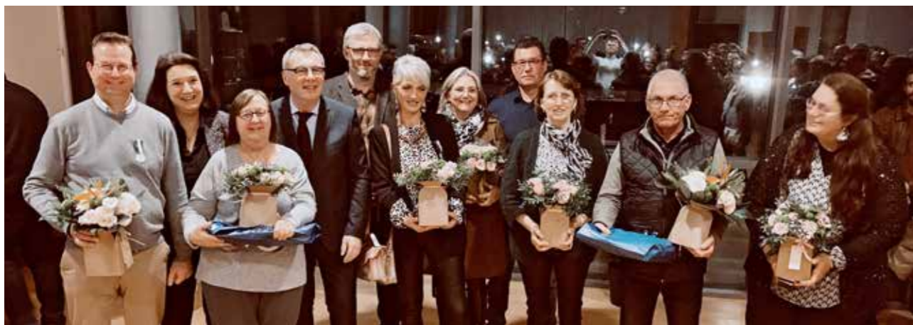
Vœux au résidents de l'EHPAD - 27 janvier