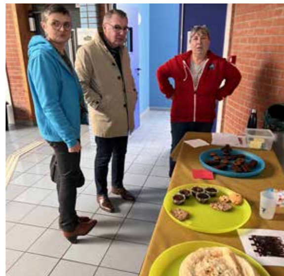
Journée des gourmandises du club de gym (SIG) - 11 janvier