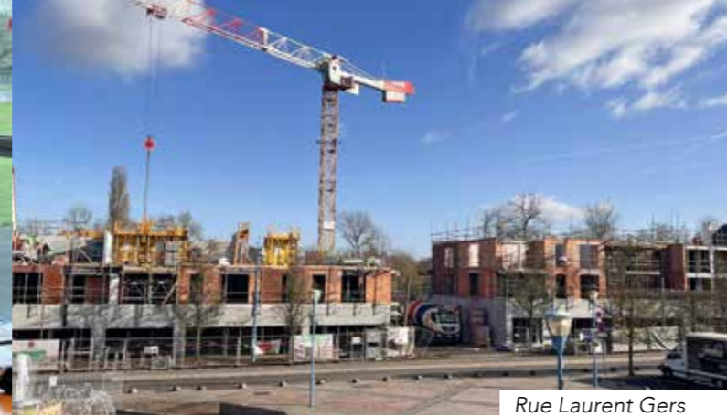
Rue Laurent Gers