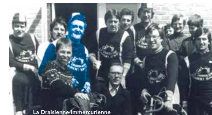
La Draisienne immercurienne

Monsieur le Maire, le Conseil Municipal, présentent ses plus sincères condoléances à sa famille ainsi qu'à ses proches.