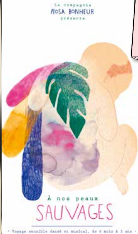
* Voyage sensible dansé et musical, de 6 mois à 3 ans *

A nos peaux sauvages est une ode à nos peaux perméables, à nos interactions sincères et à nos jeux enfantins.